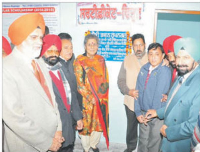
ਰਾਜ ਸਭਾ ਮੈਂਬਰ ਸ਼੍ਰੀਮਤੀ ਅੰਬਿਕਾ ਸੋਨੀ ਸੈਣੀ ਭਵਨ ਵਿਖੇ ਉਸਾਰੇ ਗਏ ਕਮਿਊਨਿਟੀ ਹਾਲ ਦੇ ਕਮਰੇ ਦਾ ਉਦਘਾਟਨ ਕਰਦੇ ਹੋਏ।